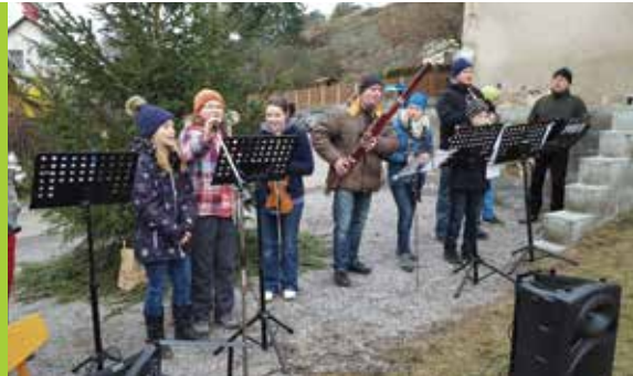
Zpívání 24. 12. 2016