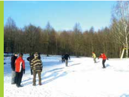
Bruslení na koupališti