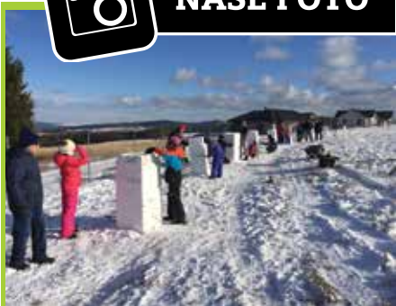
Stavění soch ze sněhu