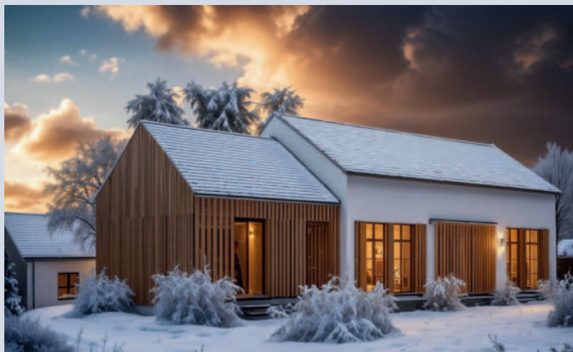
Vizualizace možného budoucího vzhledu

V přiložené anketě se můžete podělit o své nápady na další využití tohoto objektu.