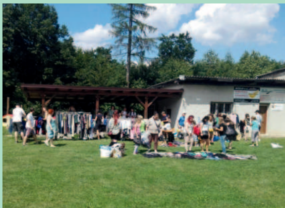
Jeden z prvních SWAPů se konal na fotbalovém hřišti